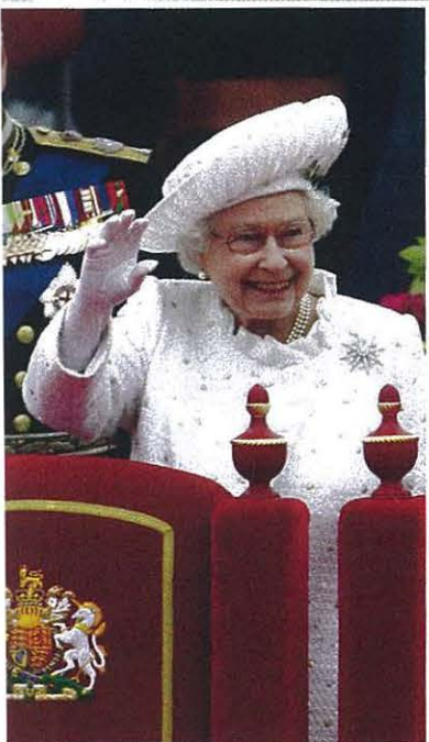
...s de règne et une parade. Dimanche 3 juin, ...e prince Philip embarquent sur la « Gloriana ».

HE MARCEAU MOUR, JE PEUX LE PREMIER PAS” UR CANADIEN CIT D'UNE ENTE AUX ENFERS